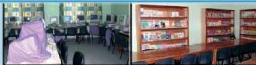
Construction d'un Centre de Documentation et d'Information - O.N.E.C.S.