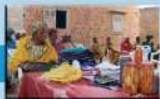
Appui aux initiatives des Organisations Féminines - Caritas Thiès

Un formulaire de requête de financement est disponible au Service de Coopération et d'Action Culturelle, auprès du Bureau des ONG, et sur le site internet de l'Ambassade de France à Dakar : www.ambafrance-sn.org