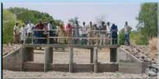
Construction de digues de retenue d'eau dans les vallées de Saré Sara et Saré Lamine - ENDA ACAS